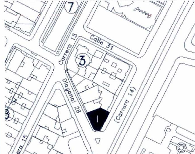
CRITERIOS DE CALIFICACION